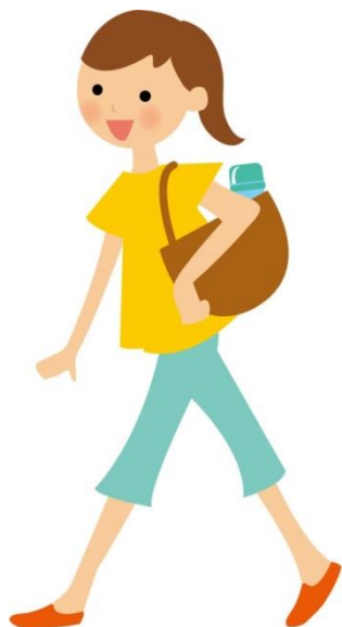
八尾の輝く女性活躍推進プロジェクト 【今後の予定】

地域活動やまちづくり活動でのリーダーシップについて学び、自分らしい貢献の仕方を考えます。 一人ひとりの思いや力がつながりあうと、地域を元気にするための大きなパワーになります。 イベント企画を通じて、企画力やリーダーシップを身につけましょう！