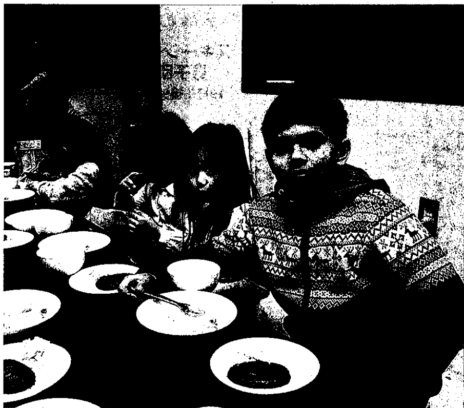
しま☆ルームで、クリームシチューやハンバーグに舌鼓を打つ子供たち —大阪府中央区島之内で