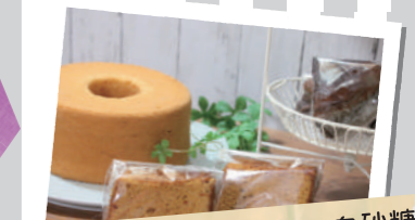
グルテンフリー・白砂糖フリーのお菓子(リアン)