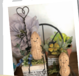
ナチュラル可愛い雑貨 (Heart工房cha-cha)