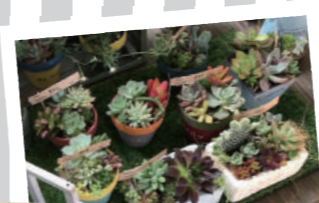
多肉植物寄せ植え (Yua's. ゆあずっと)

一人ひとりのライフサイクルのなかで、生き生きと充実した人生を送るために必要な学びを提供し、また学んだことを通じて社会参加することにより、様々な人々がつながり支え合うコミュニティづくりをめざして、生涯にわたる学習の支援を行っています。