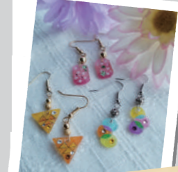
プラバンとレジンでできたキラキラ小物(ぴかず)